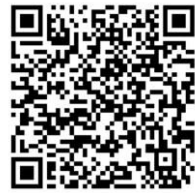
ワンデー職場体験予約