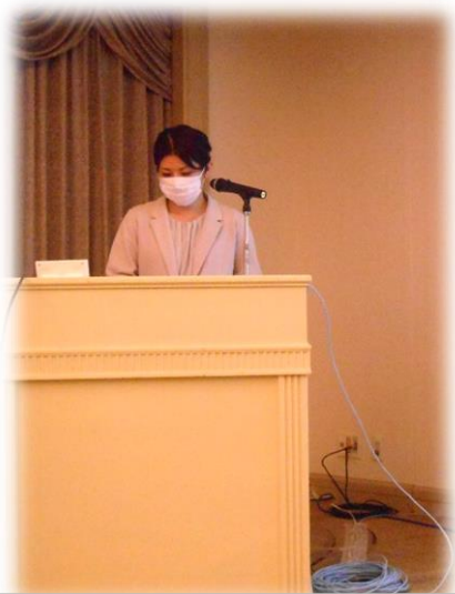
玉城管理栄養士(糖尿病療養指導士)