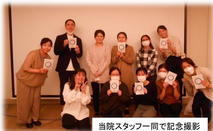
当院スタッフ一同で記念撮影